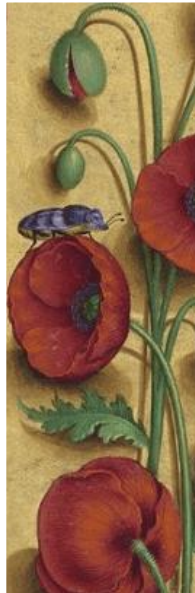
Grandes Heures d'Anne de Bretagne, f.98v (BNF), Enl. De J. Bourdichon (1457 ?-1521).