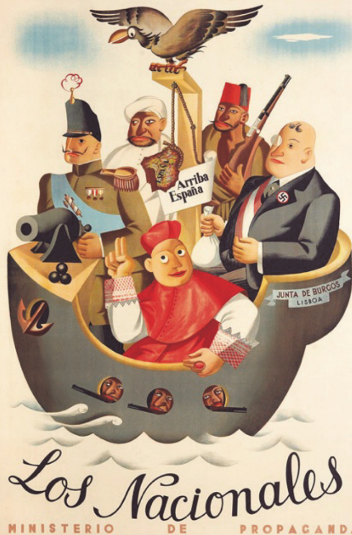
Illustration: Juan Antonio Morales, "Los Nacionales", Ministerio de Propaganda, 1937

UNIVERSITE PARIS 8 VINCENNES-SAINT-DENIS