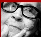
Table ronde en hommage à Neus Catala et aux femmes résistantes et déportées espagnoles

Organisation : La délégation de Catalogne en France