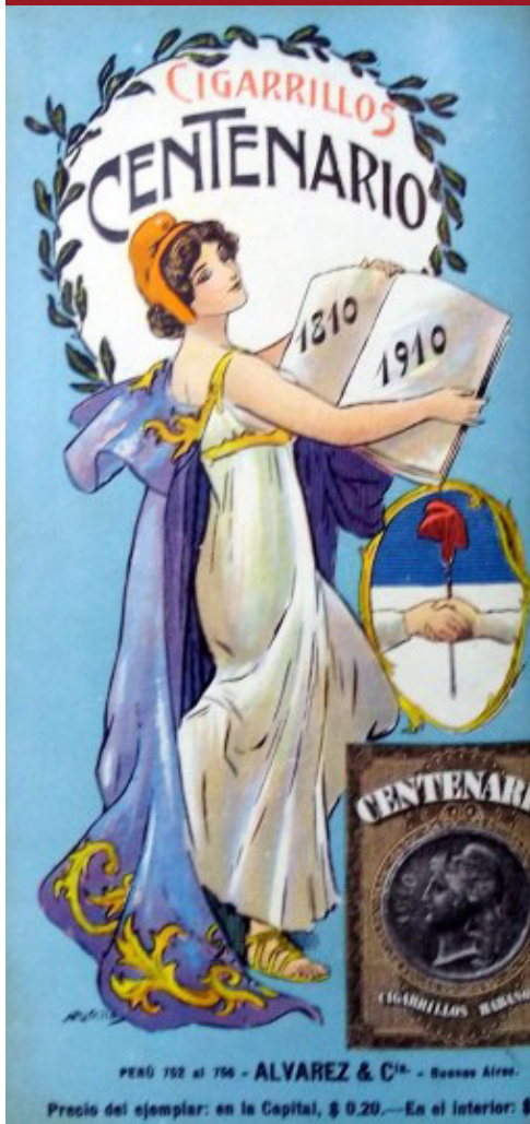
Afiche Cigarillos Centenario